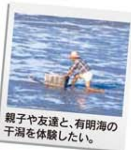
親子や友達と、有明海の干潟を体験したい。