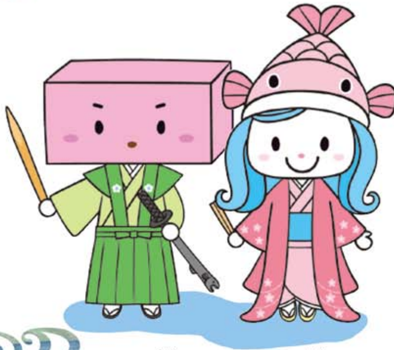
えもん 「ようかん右衛門」