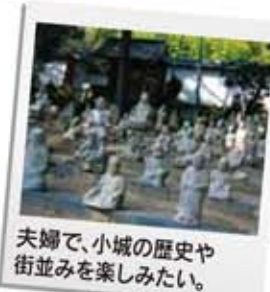
夫婦で、小城の歴史や街並みを楽しみたい。