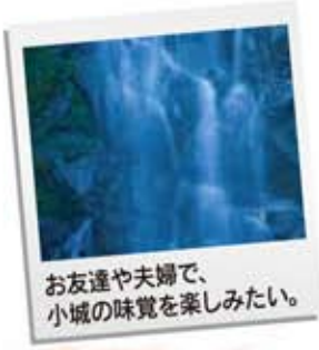
お友達や夫婦で、小城の味覚を楽しみたい。