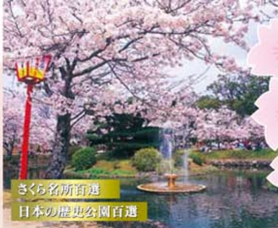
さくら名所百選 日本の歴史公園百選