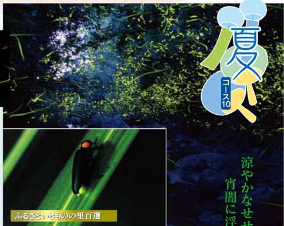
ふるさといきものの里百選