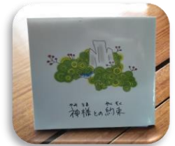
石体神様物語本付